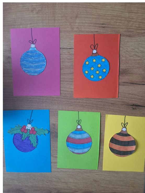
Exemples de cartes réalisées par les enfants du CME pour les personnes précaires et isolées.